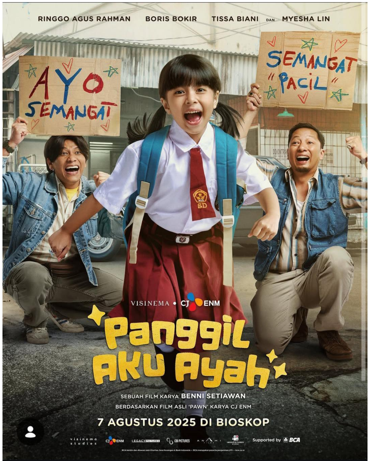
Lampiran 6 Poster Film “Panggil Aku Ayah”