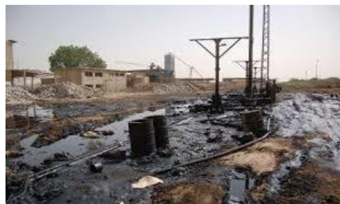
Gambar 2.4 pencemaran tanah oleh limbah industri pestisida