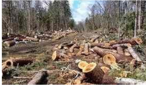
Gambar : kerusakan lingkungan karena penebangan liar 2.