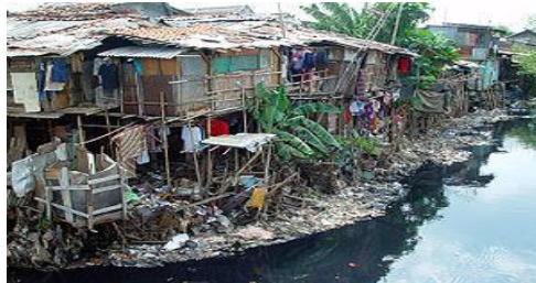
Gambar 2.2 pencemaran air karena sampah