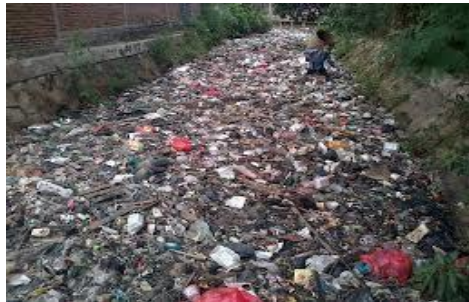
Gambar 3 limbah sampah