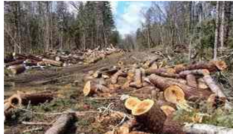
Gambar 2.1 kerusakan lingkungan karena penebangan liar