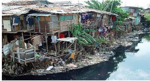
Gambar : pencemaran air karena sampah