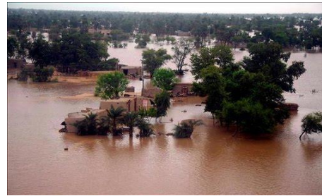
Gambar 2 banjir