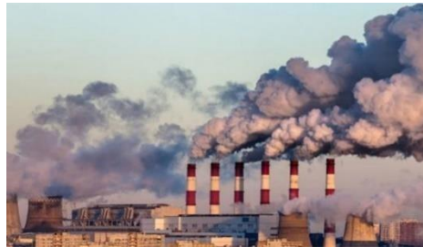
Gambar : pencemaran udara karena aktifitas industri

c) Chloro Fluoro Carbon (CFC) yang berasal dari kebocoran mesin pendingin ruangan, kulkas, AC mobil.