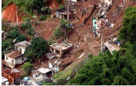
Gambar 1 tanah longsor

Cermati berbagai gambar perubahan lingkungan berikut!