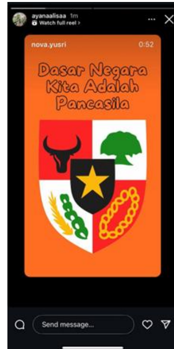
Gambar 4.2 Share Konten Edukasi