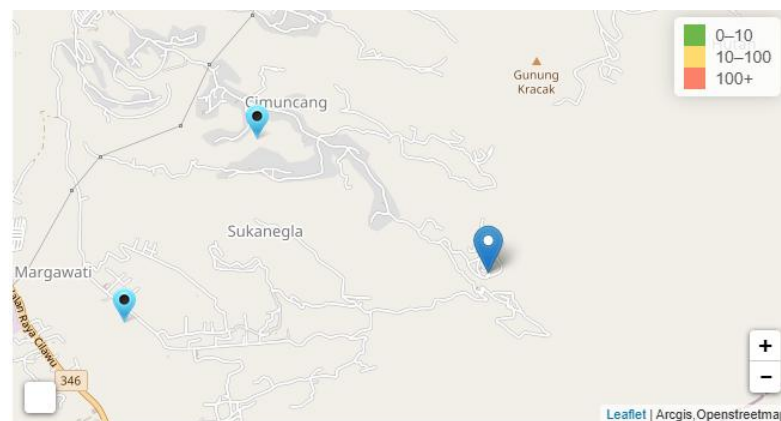
Gambar 3.1 Tempat penelitian

Penelitian dilaksanakan di SMP Pemuda Garut, yang terletak di Kabupaten Garut, Jawa Barat.