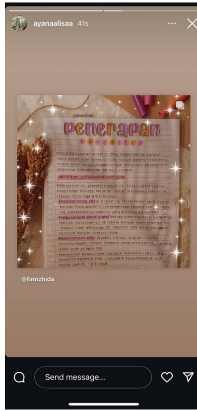
Gambar 4.3 Share Literasi PKN

Gambar di atas merupakan beberapa contoh konten dan interaksi yang terjadi selama proses pembelajaran menggunakan media Instagram.